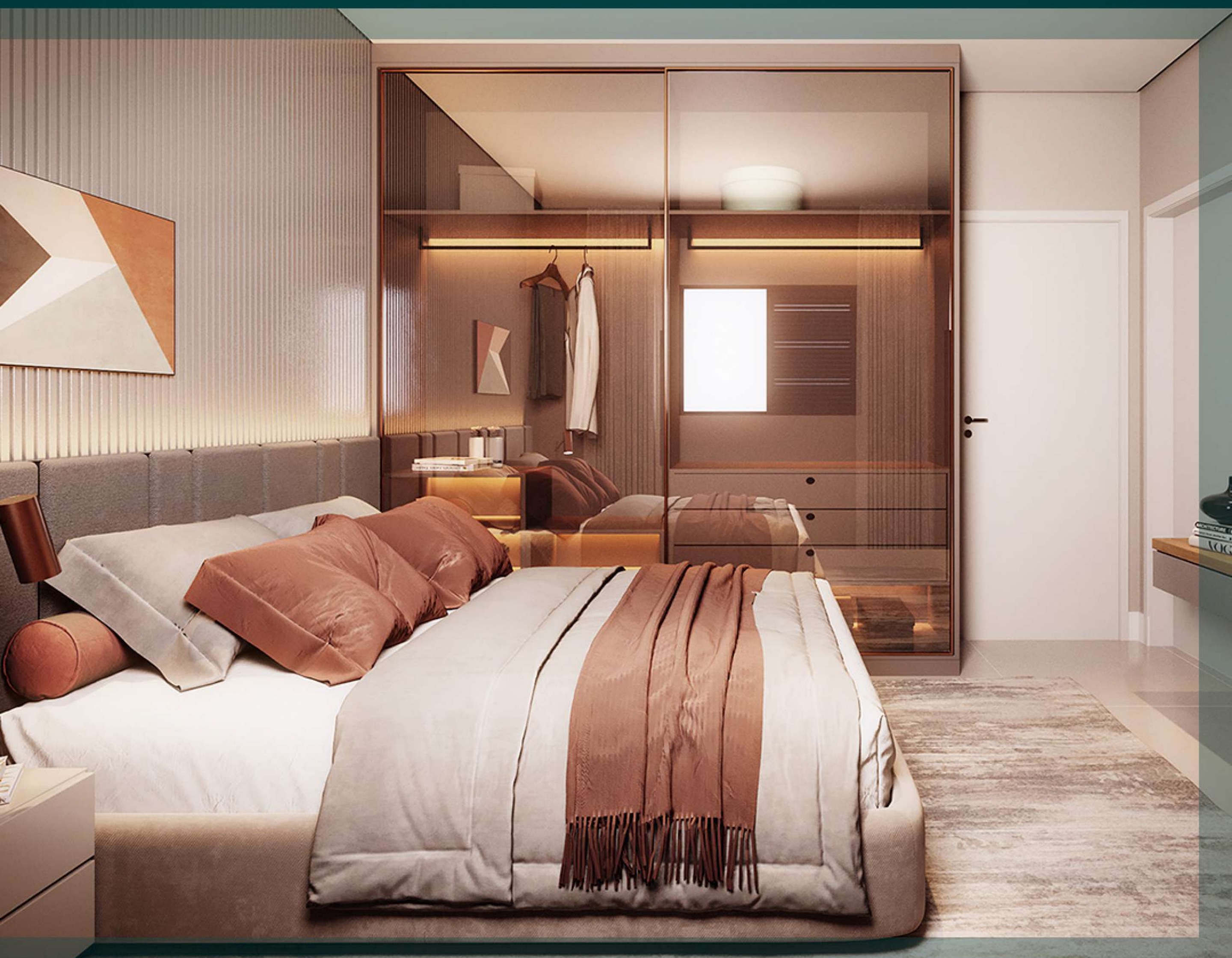
Suíte do casal