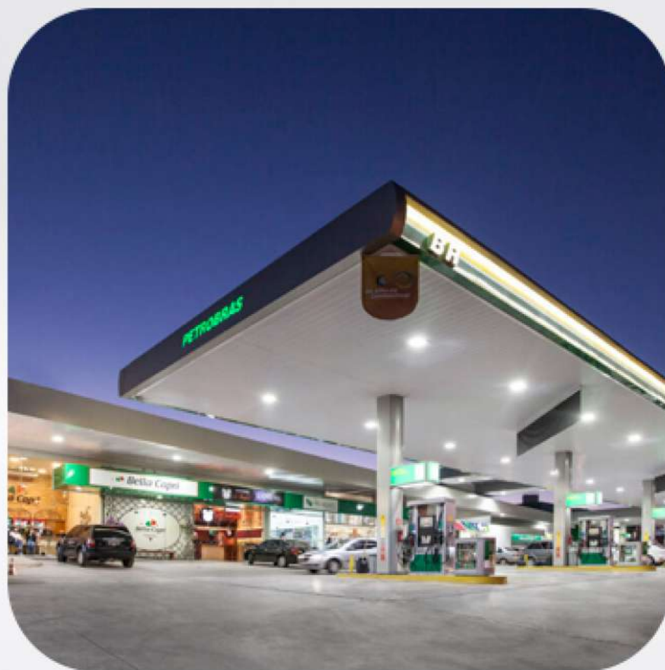
Monte Carlo Damha Posto Petrobras