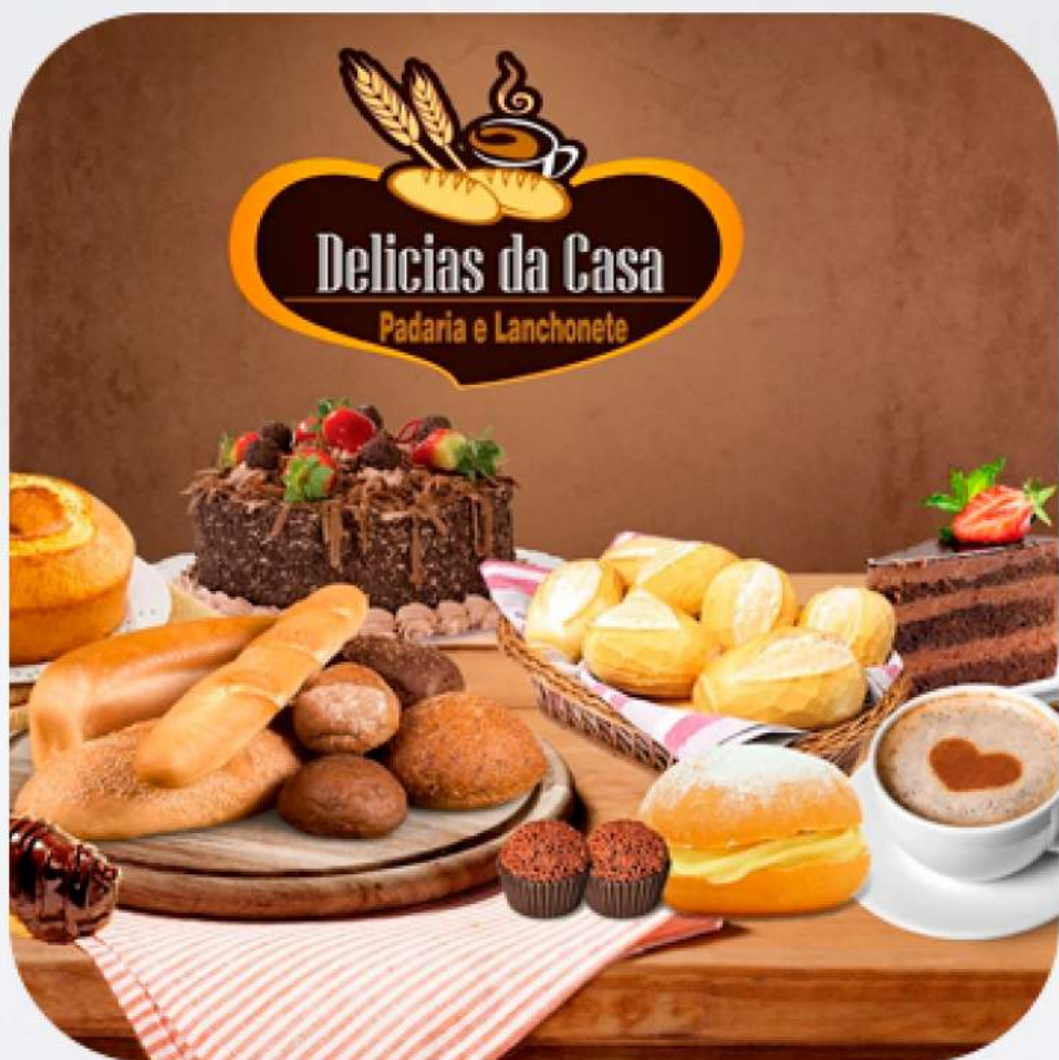
Padaria e Lanchonete Delícias da Casa