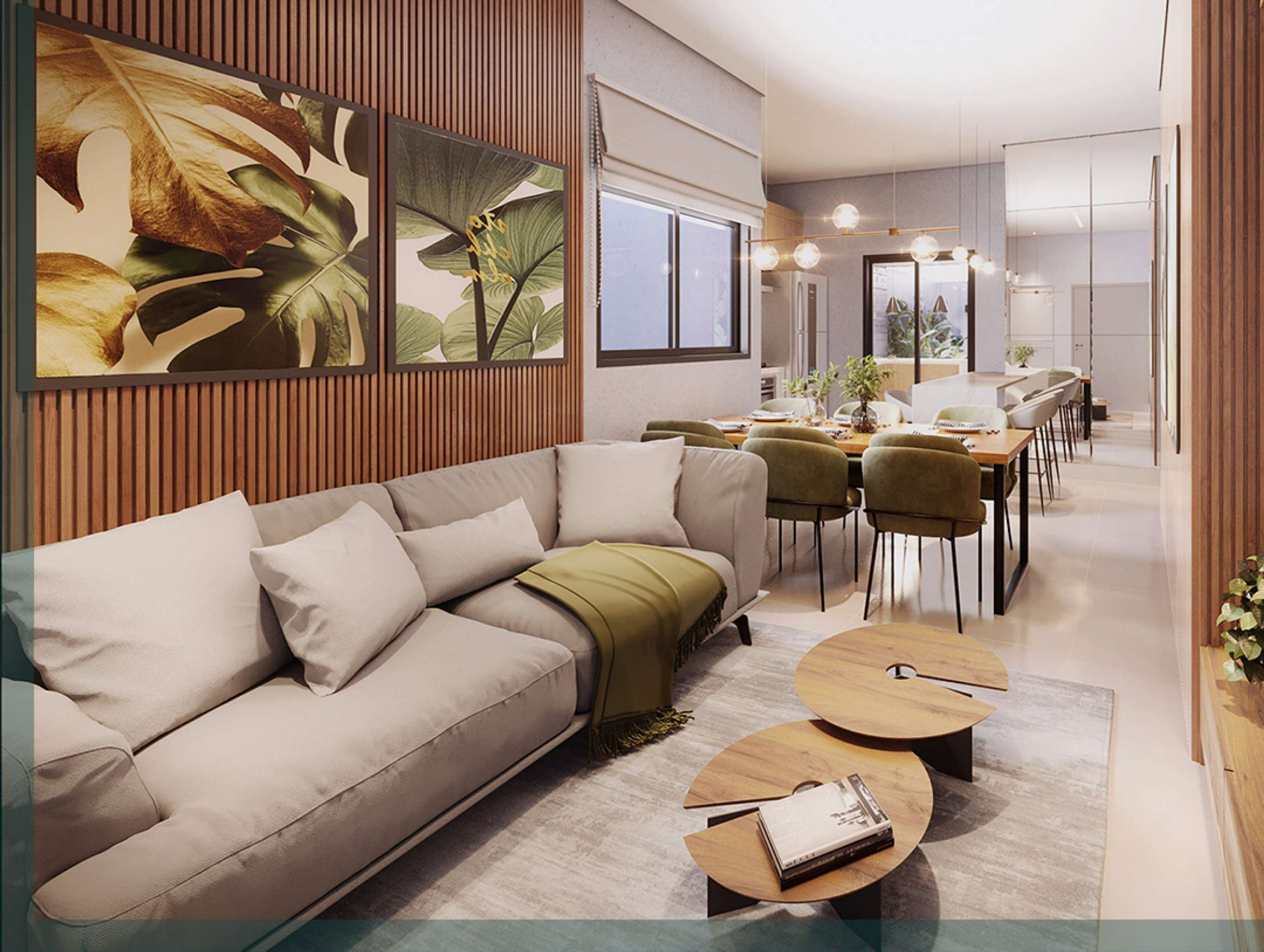
Sala integrada com a cozinha