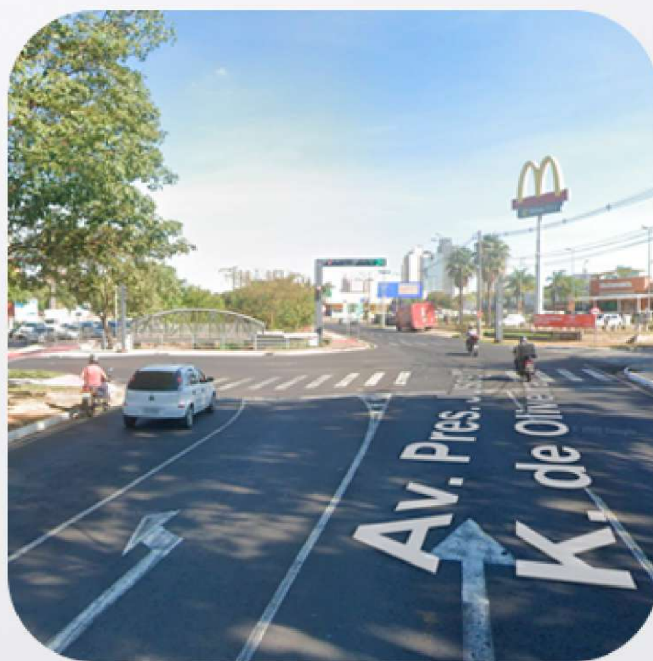
Av. Pres. Juscelino K. de Oliveira